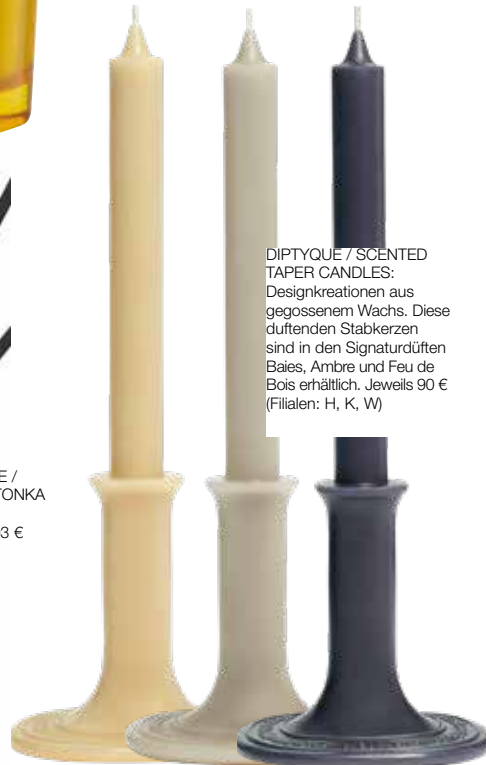
DIPTYQUE / SCENTED TAPER CANDLES: Designkreationen aus gegossenem Wachs. Diese duftenden Stabkerzen sind in den Signaturdüften Baies, Ambre und Feu de Bois erhältlich. Jeweils 90 € (Filialen: H, K, W)