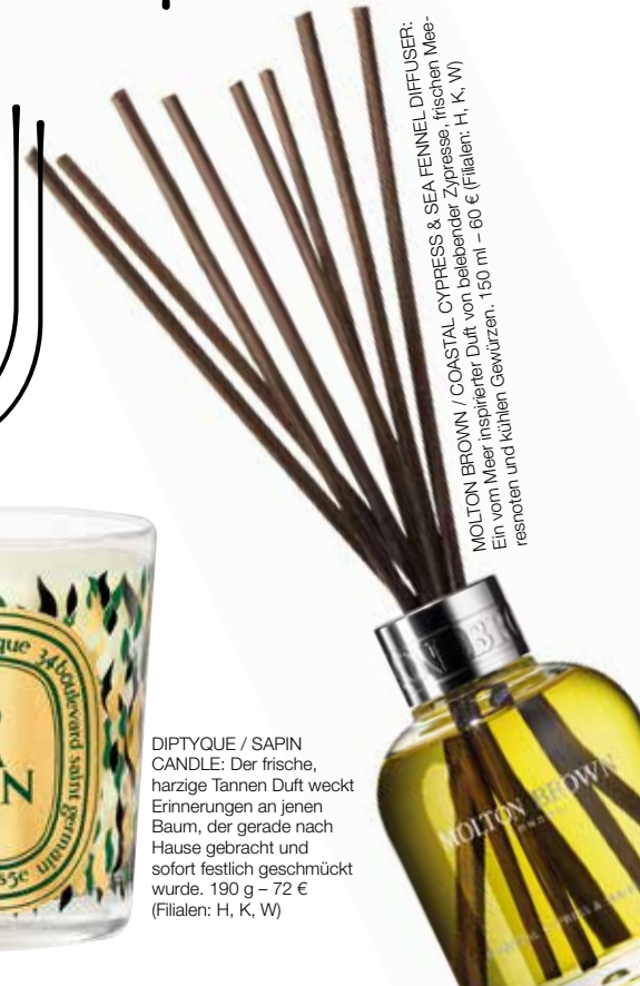
DIPTYQUE / SAPIN CANDLE: Der frische, harzige Tannen Duft weckt Erinnerungen an jenen Baum, der gerade nach Hause gebracht und sofort festlich geschmückt wurde. 190 g - 72 € (Filialen: H, K, W)