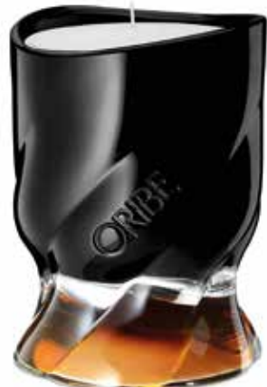
ORIBE / CÔTE D'AZUR SCENTED CANDLE: Betörend und belebend frisch, der einzigartige Duft erweckt die Sinne mit zitro- niger kalabrischer Bergamotte, La Mariposa Blanca oder weißem Schmetterlingsjasmin und Sandelholz. 227 g - 86 € (Filialen: H)

In ver- schieden- en Größen und Duft- richtungen