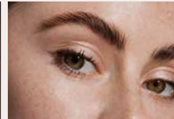
Augenbrauen und Wimpern "to go"