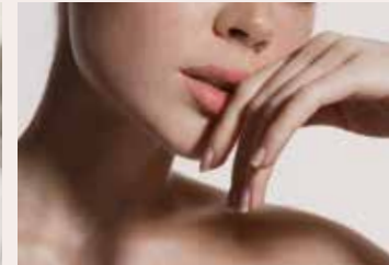
Maniküre "to go"