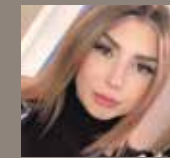
Celia Abraham Filiale Hirschstraße

MONTALE / ARABIANS TONKA EDP: Wenn man auf der Suche nach einem Parfum ist, das einen intensiven Duft mit orientalischen, warmen und süßen Noten bietet, dann ist Montale Arabians Tonka eine großartige Wahl. Das Parfum sollte sparsam aufgetragen werden, da es sehr intensiv ist. 100 ml – 141 € (Filialen: H, K, W)