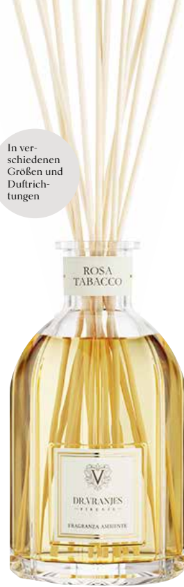
DR VRANJES / DIFFUSER: ROSA TABACCO DIFFUSER: Elegant und zart wie eine Rose, warm und kräftig wie Tabak, dieser Duft ist ein überraschendes und extravagantes Geruchserlebnis. 1250 ml - 190 € (Filialen: H)

In ver- schieden- en Größen und Duft- richtungen