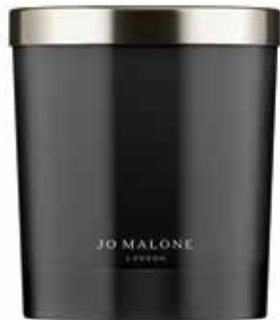
JO MALONE / MYRRH & TONKA CANDLE: Duftet nach reichhaltiger Myrrhe, vermischt mit der Wärme der Mandel und den luxuriösen Vanillearomen der Tonkabohne. 200 g - 72 € (Filialen: H)