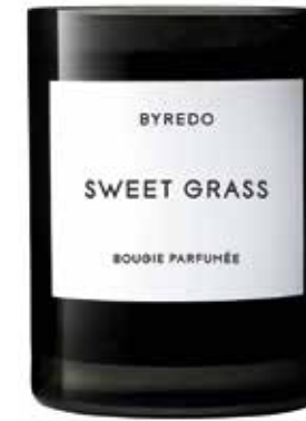
BYREDO / SWEET GRASS CANDLE: Eine aromatische Kraft von Pflanzen und Kräutern aus einer anderen Welt. 240 g - 70 € (Filialen: H, K, W)