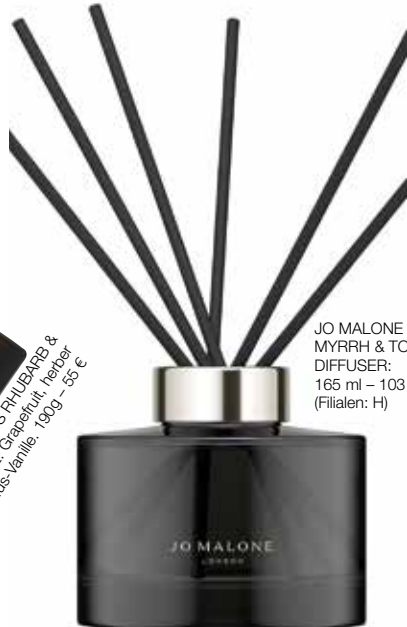
JO MALONE / MYRRH & TONKA DIFFUSER: 165 ml - 103 € (Filialen: H)